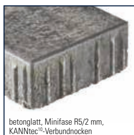
betonglatt, Minifase R5/2 mm, KANNtec 10 -Verbundnocken